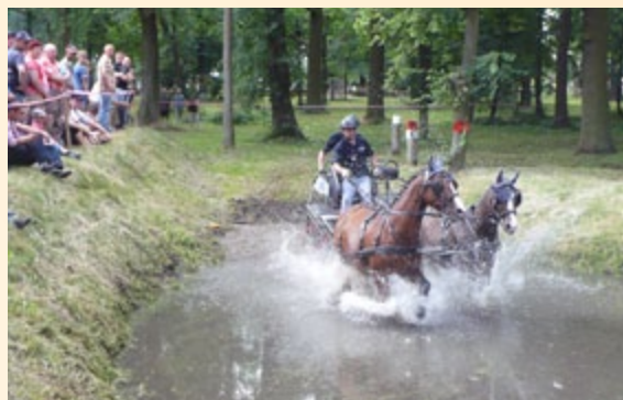
Zawody w powożeniu

Nie tylko hodowcy i producenci powozów, ale także zaproszona na to wydarzenie publiczność mogła podziwiać prawdziwy kunszt startujących w zawodach ludzi i koni, zarówno w konkurencjach sprawnościowych, jak i szybkościowych. O dużej randze tego spotkania świadczy udział w zawodach w powożeniu mistrzów Polski i mistrzów świata. Niezwykle widowiskowe były zawody powożenia w wypełnionej wodą fosie, a także kaskaderskie popisy jeźdźców, którzy zadziwiali publiczność sprawnością i brawurą w ujeżdżaniu koni. Na uczestników spotkania czekało także sporo atrakcji podczas wieczornej gali. Impreza „Konie i powozy” w znakomity sposób kultywuje tradycje nieodłącznie związane z hodowlą koni i jest przykładem działania Krajowej Sieci Obszarów Wiejskich realizującej priorytet KSOW związany z podtrzymywaniem tradycji regionalnych i lokalnych.