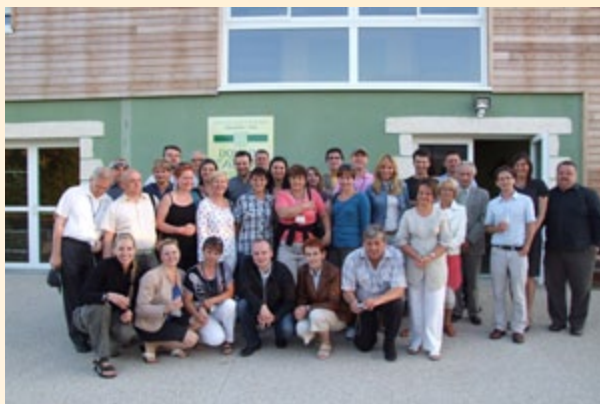
Wizyta studyjna we Francji

W dniach 29-30 czerwca 2011 r. w Białowieży odbyła się konferencja „Leader szansą na zrównoważony rozwój Podlasia”. Spotkanie było realizowane w ramach współpracy województwa podlaskiego z Lokalnymi Grupami Działania. Tematem konferencji było omówienie kwestii przekazywania środków na realizację lokalnych strategii rozwoju. Główny cel konferencji to podsumowanie dotychczasowych działań LGD funkcjonujących na terenie województwa podlaskiego. Ponadto dokonano podsumowania działań samorządu województwa we wdrażaniu osi 4 Leader PROW 2007-2013. Konferencja przybliżyła także perspektywy realizacji działań KSOW na lata 2012-2013. Spotkanie było ponadto szansą do zaprezentowania dotychczasowych dokonań Lokalnych Grup Działania, wymiany doświadczeń, prezentacji dobrych praktyk, jak również stanowiło okazję do zacieśnienia dalszej współpracy pomiędzy podlaskimi LGD.