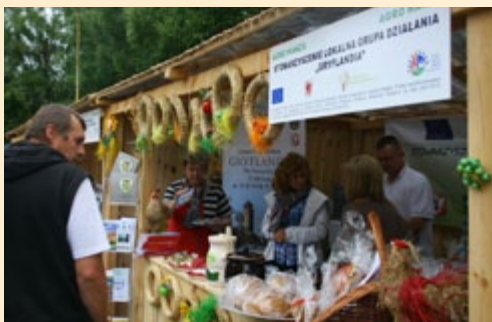
LGD z Pomorza Zachodniego prezentowały wytwory rzemieślnicze i artystyczne