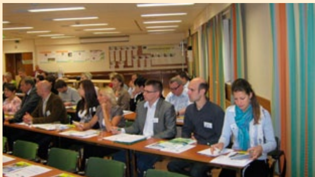
Wizyta LGD w Finlandii