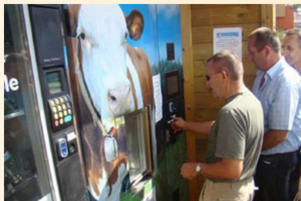
Wyjazd studyjny do regionu Rhône-Alpes

W wyjeździe studyjnym do partnerskiego regionu Rhône-Alpes w dniach 13-20 czerwca uczestniczyło 25 przedstawicieli Lokalnych Grup Działania oraz pracownicy Urzędu Marszałkowskiego i Centrum Doradztwa Rolniczego. W trakcie wizyty doszło do spotkań z urzędnikami reprezentującymi władzę regionalną, obecni byli również członkowie związków gmin i stowarzyszeń. Szczególnie cenne dla uczestników wyjazdu do Rhône-Alpes były spotkania z tamtejszymi beneficjentami działań Leader, a także spotkania z członkami LGD funkcjonujących w tym regionie. Innym interesującym elementem wyjazdu była prezentacja projektu pn. „Fontanna mleka” oraz wspólny punkt sprzedaży dla rolników.