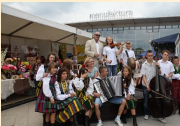
Warsztaty produktów regionalnych

było w czym wybierać. Wszyscy zainteresowani smakiem produktów tradycyjnych posiadających wpis na listę prowadzoną przez MRiRW mieli wiele sposobności, by skosztować chleba nagawskiego wiecznie świeżego, koziego twarogu z Eufeminowa, miodów z doliny Mrogi, piwa żywego, soku jabłkowego z Kałęczewa i wielu innych. Wiele emocji wzbudzały występy zespołów folklorystycznych, które tego dnia walczyły o statuetkę Folknuty. Wybór zwycięzców nie należał do najłatwiejszych. Komisja konkursowa musiała wybrać spośród 34 zgłoszonych do udziału w konkursie zespołów. Na podium stanęły trzy zespoły, które otrzymały z rąk Marszałka Województwa Łódzkiego statuetki Folknuty oraz podziękowania za trud włożony w kultywowanie