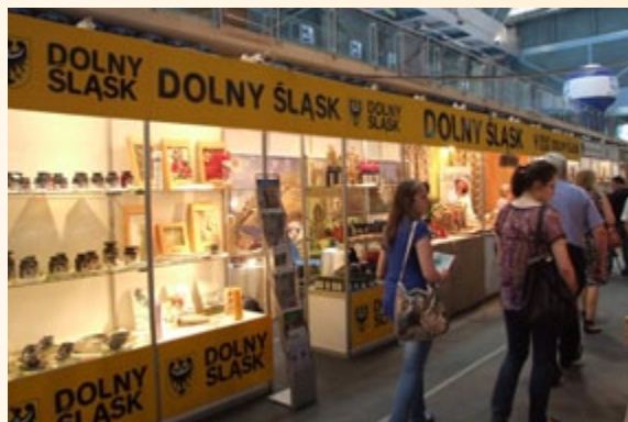
Dolnośląskie na targach EKOLOGA 2011

W dniach 20-22 maja 2011 r. w Rzeszowie odbyła się piąta edycja Międzynarodowych Targów Produktów i Technik Ekologicznych EKOLOGA 2011. Stoisko województwa dolnośląskiego cieszyło się wielkim zainteresowaniem odwiedzających targi gości związanych z tematyką żywności oraz wyrobów ekologicznych. Na stoisku województwa dolnośląskiego prezentowane były wyroby z lnu, przedsiębiorstwa „Świat Lnu”, kozie sery z Ekologicznego Gospodarstwa Sadowniczego „Malinowa Zagroda” oraz sery z Gospodarstwa Agroturystycznego „Wańczykówka”, a także przetwory z ekologicznej aronii z firmy „Eko-Ar”. Szeroka i ciekawa oferta wystawców oraz atrakcyjny wygląd stoiska skupiały uwagę odwiedzających targi gości oraz przedstawicieli mediów. Udział województwa dolnośląskiego w tej imprezie w znacznym stopniu przyczynił się do rozpropagowania dolnośląskich produktów ekologicznych oraz do zaznaczenia obecności naszego województwa w gronie tych regionów, które w aktywny sposób dążą do rozwoju oraz szerokiej promocji wyrobów ekologicznych. Szeroka gama produktów prezentowanych na stoisku województwa dolnośląskiego była sygnałem dla odwiedzających targi gości, że Dolny Śląsk może zaproponować interesującą ofertę tak artykułów spożywczych, jak również innych wyrobów ekologicznych. Sukces wystawców oraz wielkie zainteresowanie stoiskiem przyczyniły się do promocji województwa dolnośląskiego wśród gości z różnych regionów Polski, a także z zagranicy.