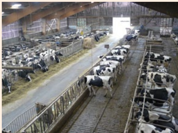
Wyjazd studyjny do Francji