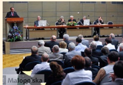
Uczestnicy konferencji nt. przyszłości drobnych gospodarstw rolnych w UE

W dniach 8-9 lipca br. odbyła się międzynarodowa konferencja pn. „Teraźniejszość i przyszłość drobnych gospodarstw rolnych w Unii Europejskiej”. Spotkanie zorganizowane zostało z inicjatywy Ministra Rolnictwa i Rozwoju Wsi oraz polskich eurodeputowanych zajmujących się tematyką przyszłości Wspólnej Polityki Rolnej. W pierwszym dniu konferencji odbyła się sesja plenarna, podczas której żywo dyskutowano o roli, jaką pełnią i mają w przyszłości pełnić drobne gospodarstwa rolne. Wszyscy prelegenci podkreślali, iż niemożliwe jest uniwersalne zdefiniowanie drobnych gospodarstw dla wszystkich krajów członkowskich UE. Każde państwo ma bowiem swoją specyfikę rolnictwa i to od decyzji wewnętrznych struktur zależeć powinno zaliczenie gospodarstw do kategorii małych bądź dużych. W drugim dniu kon-