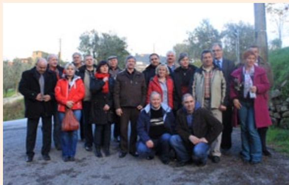
Wyjazd studyjny do Włoch

– Identyfikacja i analiza możliwych do przeniesienia dobrych praktyk w zakresie rozwoju obszarów wiejskich oraz przekazanie informacji na ich temat (Konferencja na temat prezentacji dobrych praktyk na rzecz rozwoju obszarów wiejskich, z uwzględnieniem ochrony środowiska – podkreślenie pozytywnej roli rolnictwa w walce ze zmianami klimatu) , np. konferencja w dniu 16 września 2010 r. w Spale pn. „Polskie rolnictwo w nowej perspektywie finansowej Unii Europejskiej w kontekście produkcyjnym i środowiskowym”, na której omówiono tematy odnoszące się do Wspólnej Polityki Rolnej po 2013 r., dobrych praktyk rolniczych na rzecz ochrony środowiska z uwzględnieniem zmian klimatycznych, zmiany kryteriów wyznaczających obszary o niekorzystnych warunkach gospodarowania