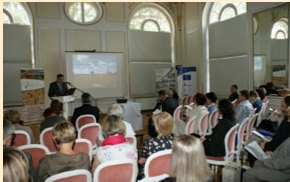
Uczestnicy konferencji „Wiejska przestrzeń – zagrożone dziedzictwo”