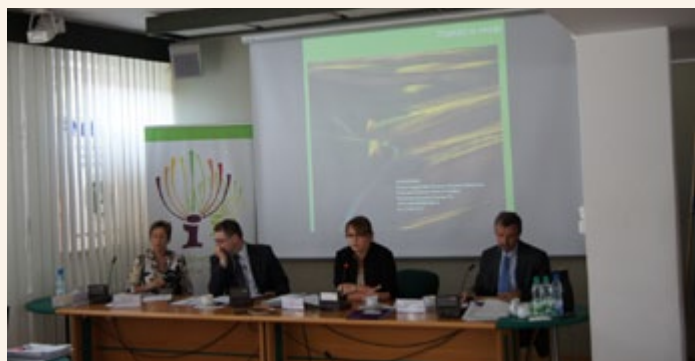
Prezydium VII posiedzenia Grupy Roboczej ds. KSOW

2. Promowanie rozwoju przedsiębiorczości na obszarach wiejskich oraz wspólnych form działalności gospodarczej.